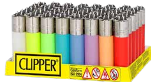
ENCENDEDOR CLIPPER 412.010