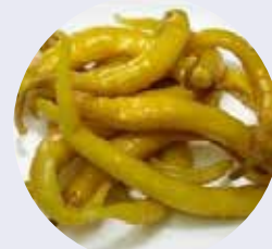
PIPARRA 1.6kg ESC.