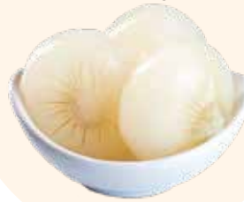
CEBOLLA GORDA S/A 2.150kg ESC