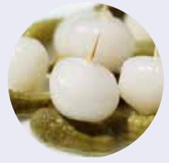
PIKOS S/A 2kg ESC NAVARRAS