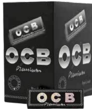
PAPEL DE FUMAR OCB