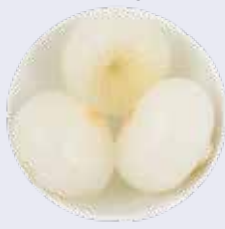
CEBOLLAS 30/35 S/A 2.2kg ESC.