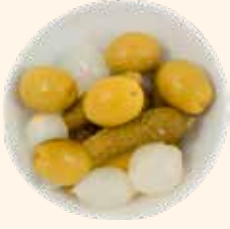
REVUELTO 2.25kg ESC.