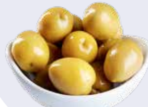
ACEITUNA VERDE S/ANCHOA 2.5kg