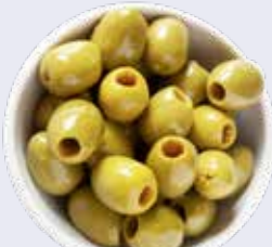
ACEITUNA RELL. ANCHOA 700GR