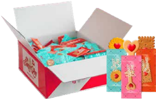
GALLETAS CORTESÍA 253.303