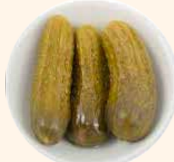
PEPINOS 30/40 S/A 2.15kg ESC