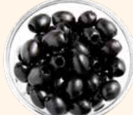
ACEITUNA NEGRA 3KG